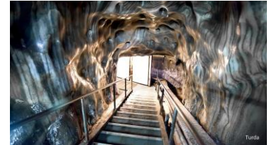
Kopalnia soli Turda