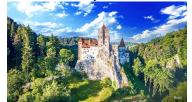
Zamek w Bran